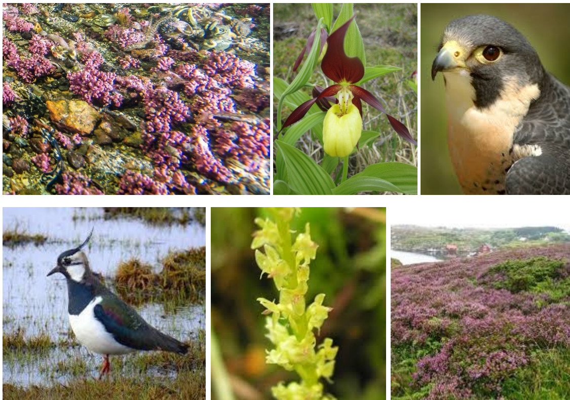
Figur 3 Rugelbunn, marisko, vandrefalk, vipe, myggblom og kystlynghei er eksempler på naturtyper og arter vi ønsker innspill om.