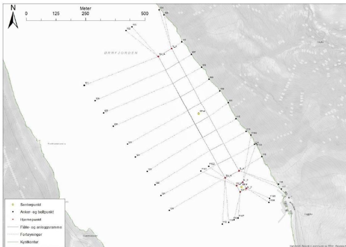
Figur 1 Viser eksisterende anlegg i Ørnfjordbotn og tidligere omsøkte plassering av forflåte også inntegnet.