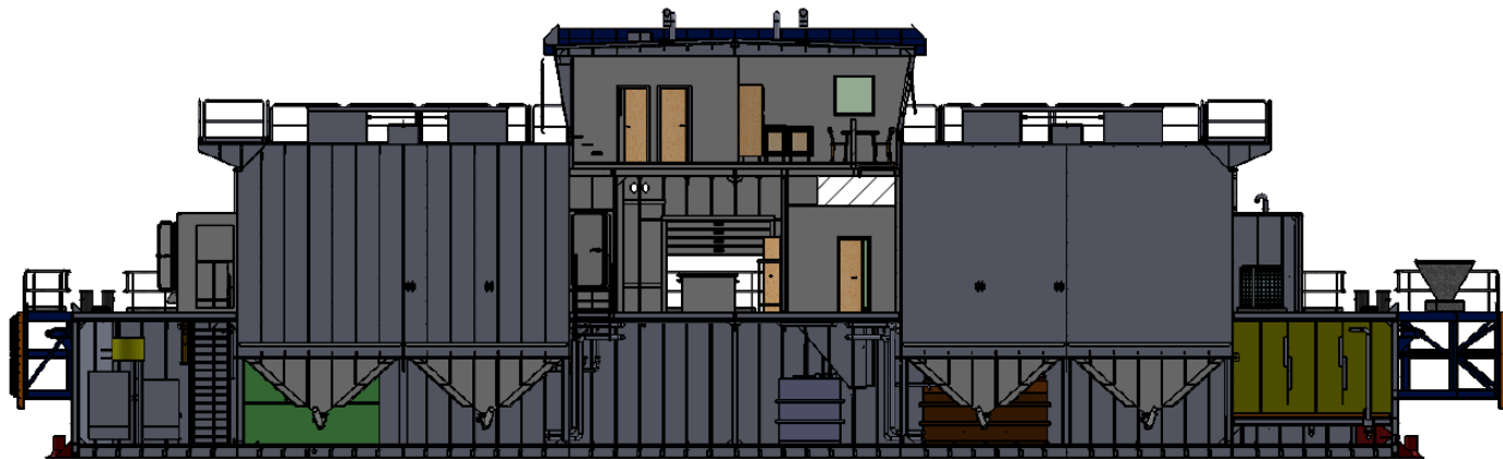
SECTION K-K SCALE 1 : 125