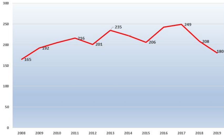
Felt elg på Senja øy og Lenvik fastland