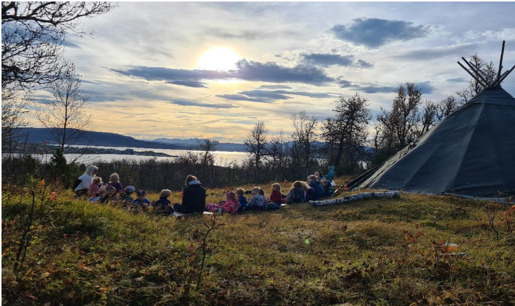
Lavoen til Furumoen